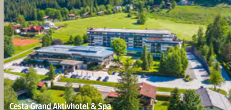
Cesta Grand Aktivhotel & Spa

Fidelity Hotels und Resorts Betriebs- und Verwaltungs GmbH Stephanstraße 1 D-60313 Frankfurt am Main www.fidelity-hotels.com Tel.: +49 (0)69-29 80 15 914