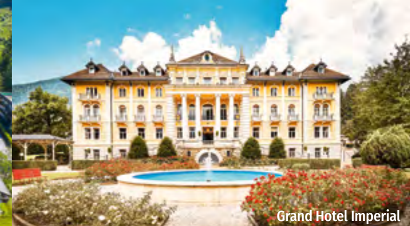
Grand Hotel Imperial