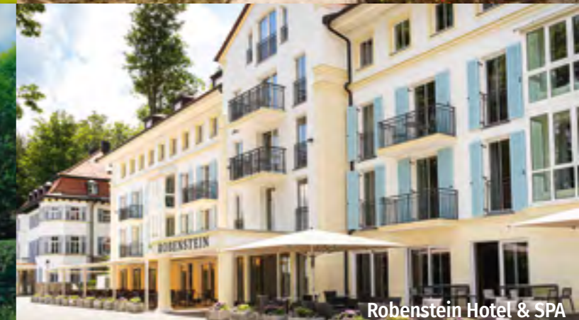
Robenstein Hotel & SPA